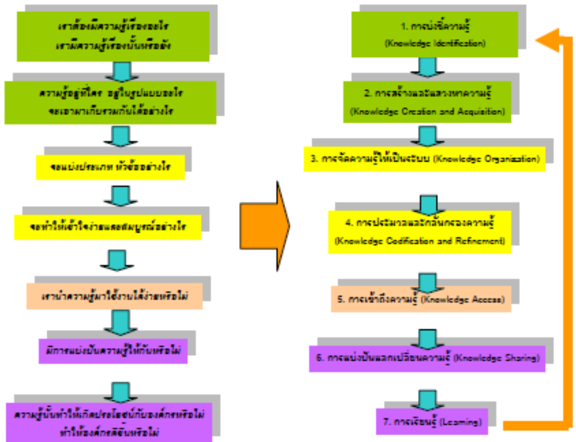
กระบวนการจัดการความรู้ (Knowledge Management)

กระบวนการจัดการความรู้ (Knowledge Management Process) และกระบวนการบริหารจัดการการเปลี่ยนแปลง (Change Management Process) องค์การบริหารส่วนตำบลด่านช้าง ได้นำมาประยุกต์ใช้ในการจัดทำแผนการจัดการความรู้ (KM Action Plan)