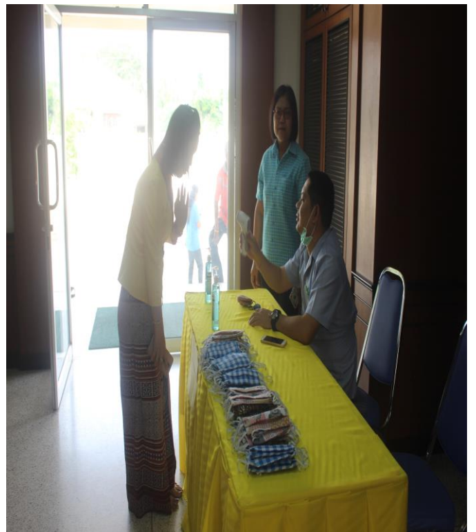
สถานที่ : ศูนย์เรียนรู้การพัฒนาคุณภาพชีวิตอย่างพอเพียง อำเภอบัวใหญ่ จังหวัดนครราชสีมา